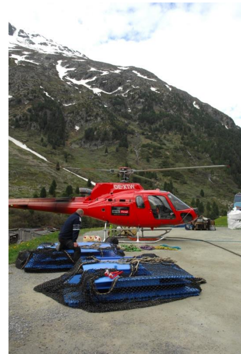
Flugtransport 4 x 600 kg